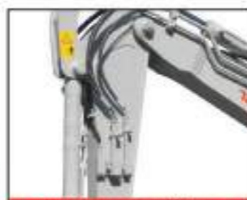
Multi lignes auxiliaires