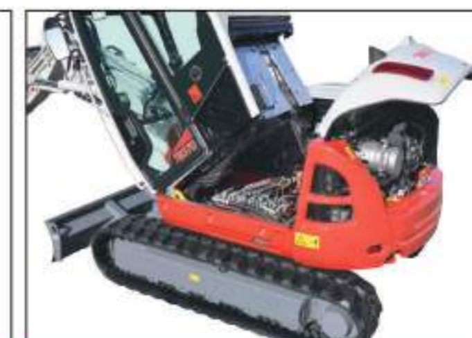
Cabine basculante à 35°