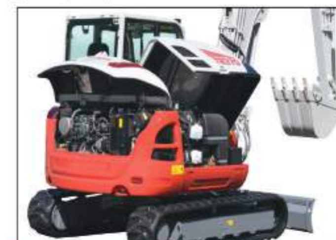
Accessibilité pour une maintenance aisée