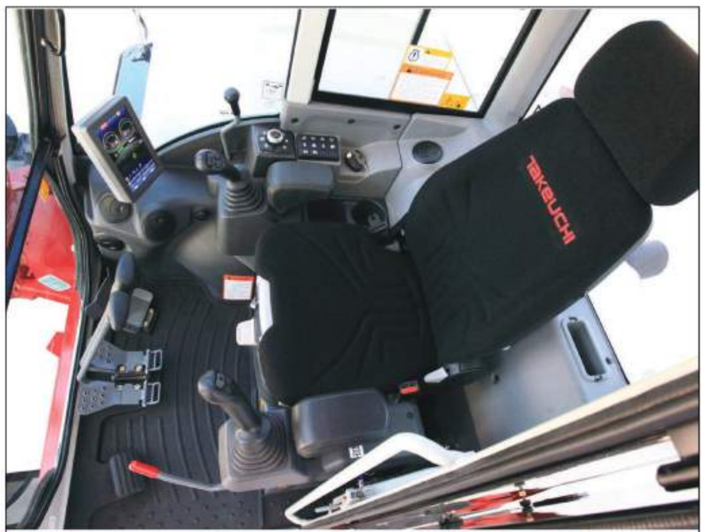
Design intérieur soigné et spécifique pour un confort optimal de l'opérateur

Cette option apporte une puissance accrue lors de travaux difficiles. Deux angles de godet sont possibles : 195° en standard pour une position de chargement idéale ainsi qu'un power mode qui limitera la fermeture de celui-ci à 125° tout en offrant une puissance de cavage plus élevée.