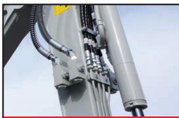
Jusqu'à 4 Ports (Option)