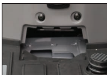
Trappe de lavage