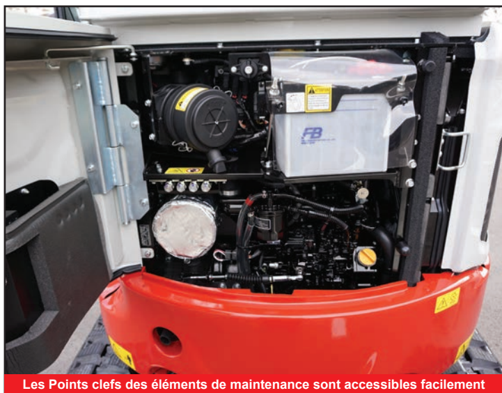
Les Points clefs des éléments de maintenance sont accessibles facilement